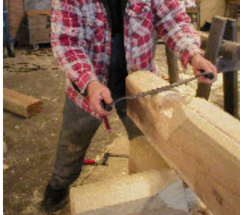
Stocken lyfts bort och långdraget sågas ut. Knuten skalas av i underkant