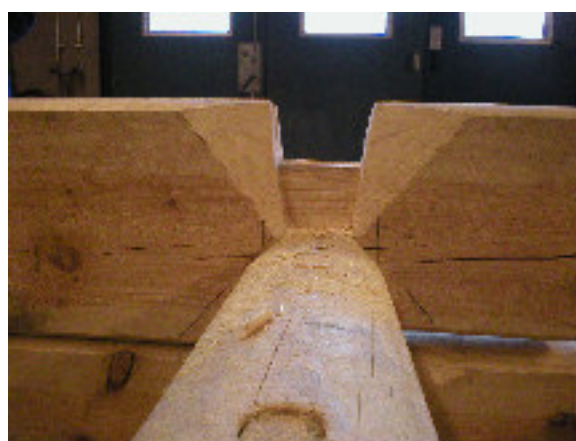
Overhak – insidan efter halsning.