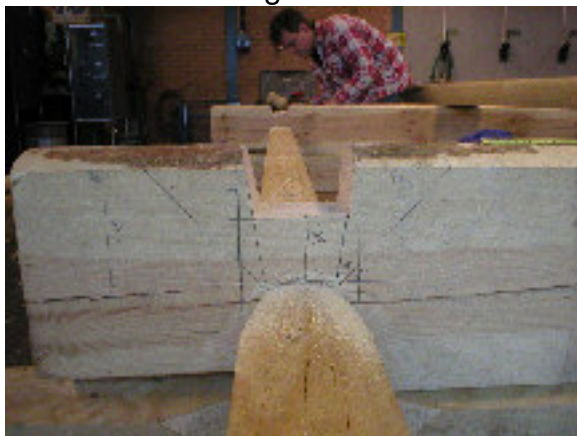
Överhak – utsågat