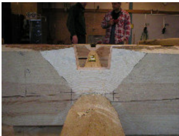
Overhak – utsidan efter halsning