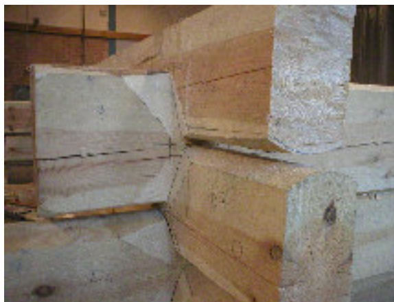
Efter justeringar av halsspåren ligger stocken på plats