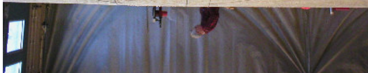
Underhak - mättning