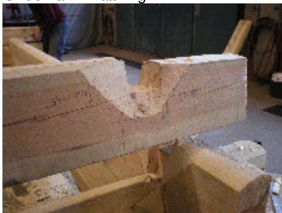
Underhak – utsågat, halsat och klart