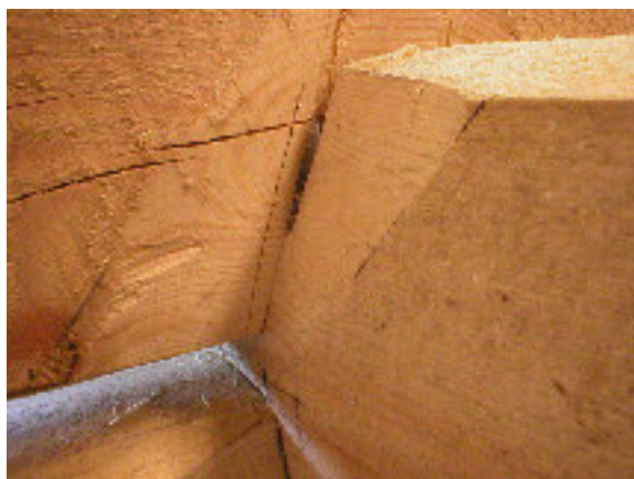
Med spetspassaren markeras hur mycket som skall justeras och med passaren ritas linjer för justeringar i 6st halsningar