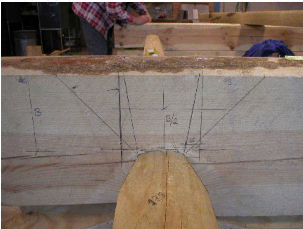
Överhak - mätning