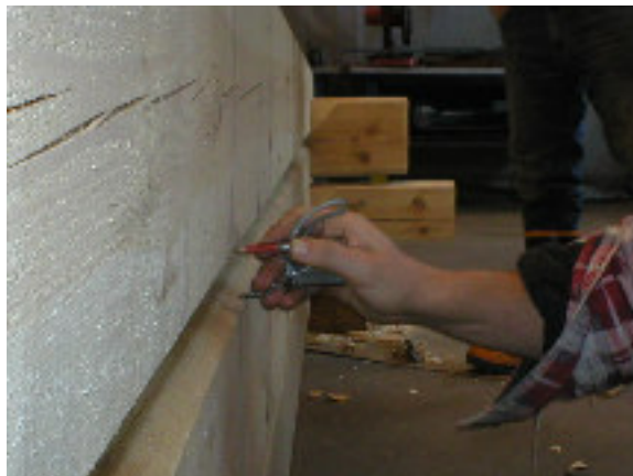
Här ser man hur mycket stocken ska sjunka och långdraget ritas med passare