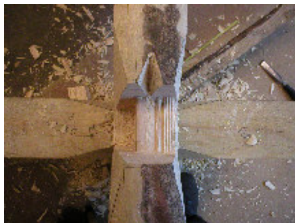
Överhak – klack och drevspår